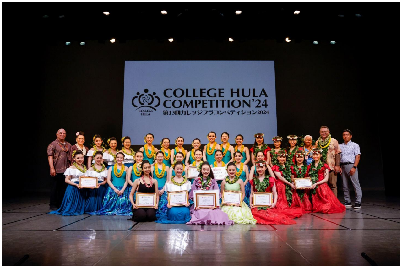
第13回カレッジフラコンペティション2024